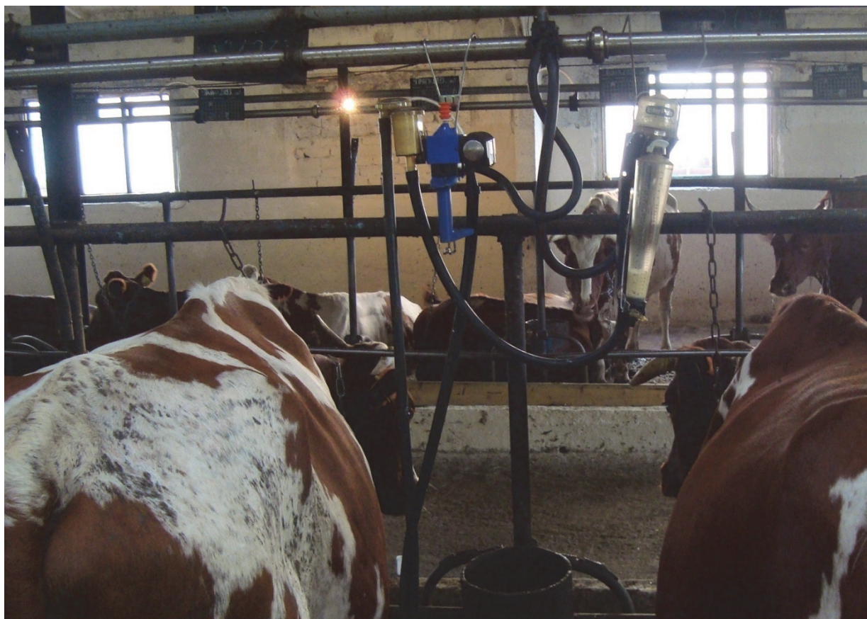
Рис 2.- Проведение контрольной дойки и отбора проб молока с использованием счетчика молока WAIKATO