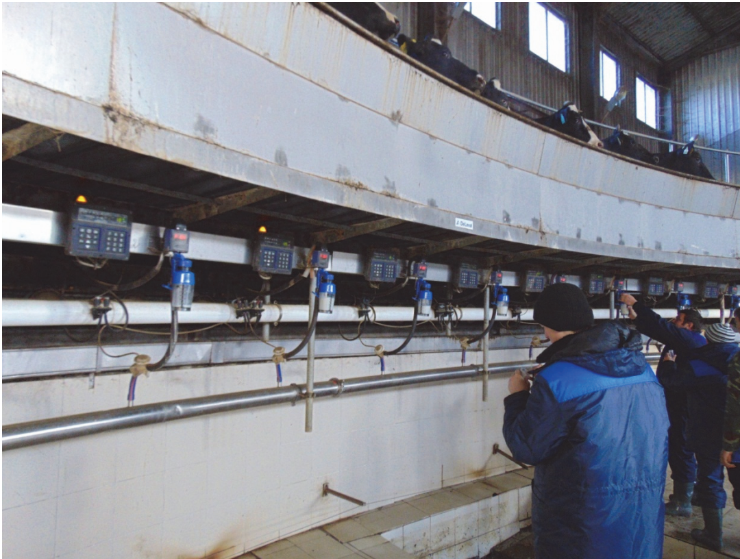
Рис. 3 - Отбор проб молока специалистами контроль-ассистентской службы в ООО «Чапаевское» Шпаковского района